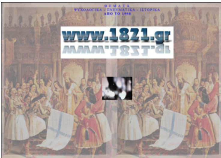
Εικ. 8. Λεπτομέρεια από την αρχική σελίδα του Νικηφόρου, [ http://www.1821.gr ].

Ωστόσο, παρά τις αρχικές δηλώσεις και τις εικόνες συμβόλων του εθνικού παρελθόντος που διαδέχονταν η μια την άλλη στο τέλος της σελίδας, η μοναδική ενότητα η οποία παρέμεινε χωρίς περιεχόμενο έξι τουλάχιστον χρόνια μετά το πρώτο ανέβασμα του κόμβου στο διαδίκτυο ήταν η ενότητα με τίτλο «Η Ιστορία που δεν πρέπει να ξεχνάμε».