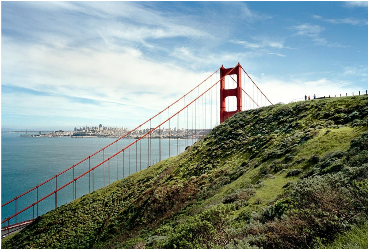
Φωτογραφία 6. Γιώργης Γερόλυμπος, Golden Gate San Francisco California (2008)