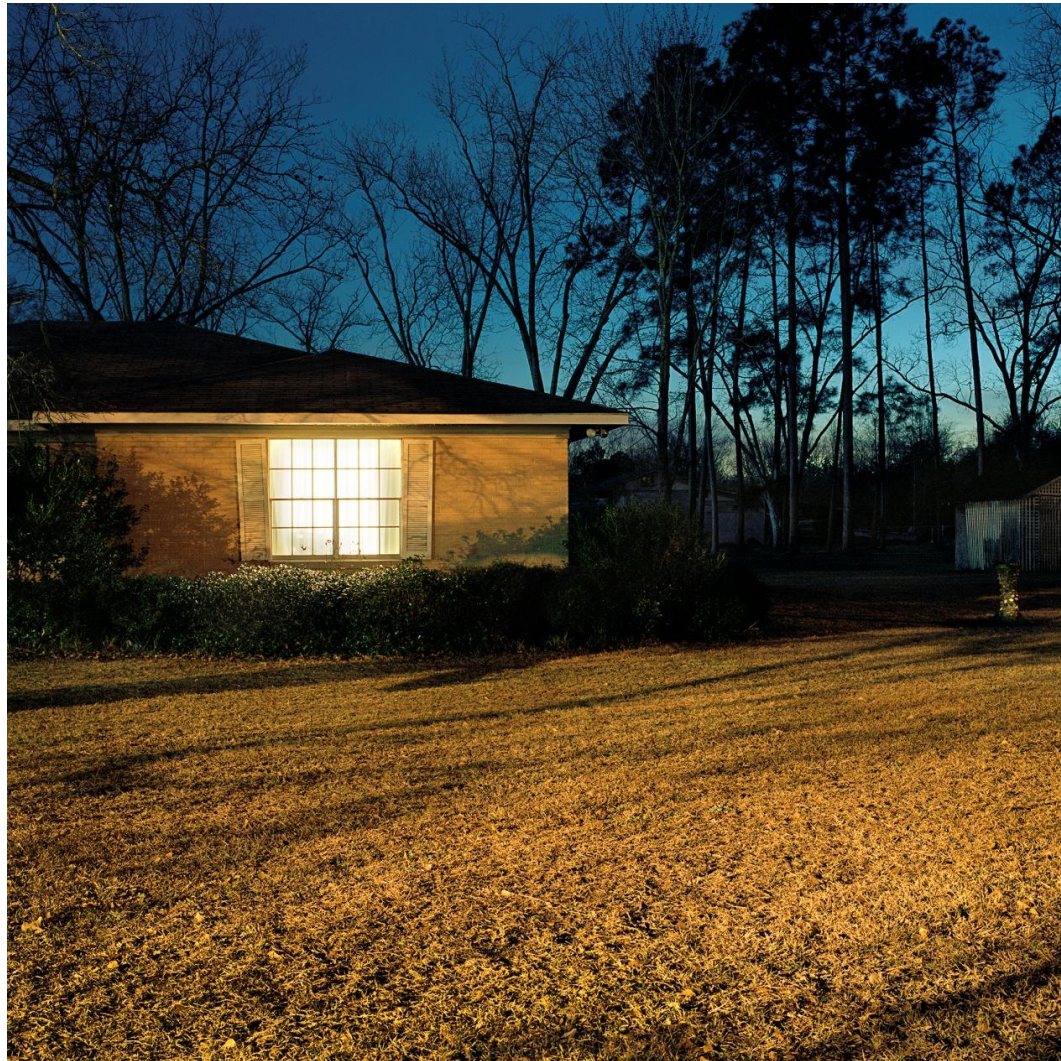
Φωτογραφία 7. Γιώργης Γερόλυμπος, Hazelhurst Georgia (2008)