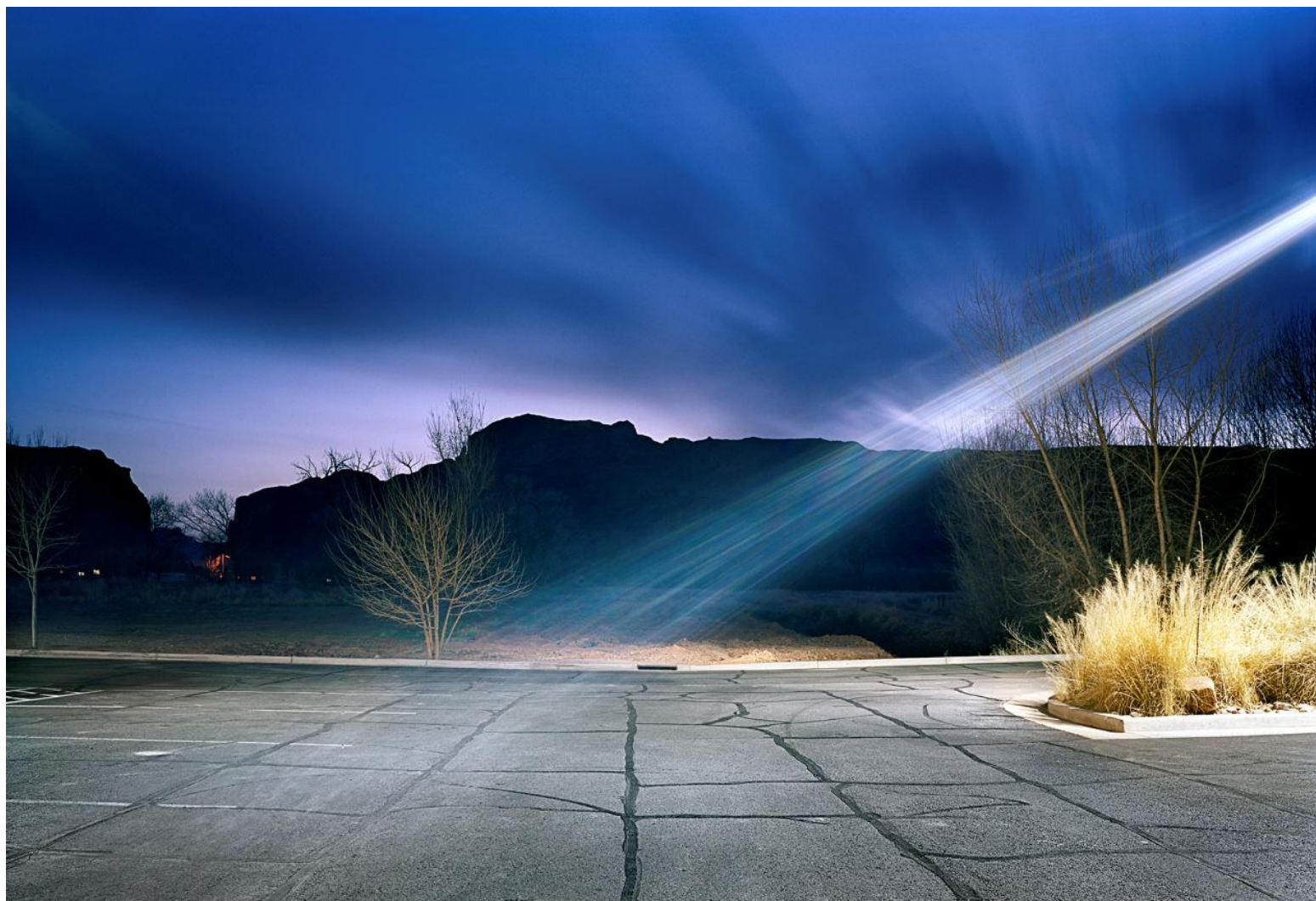
Φωτογραφία 11. Γιώργης Γερόλυμπος, Moab Utah (2008)