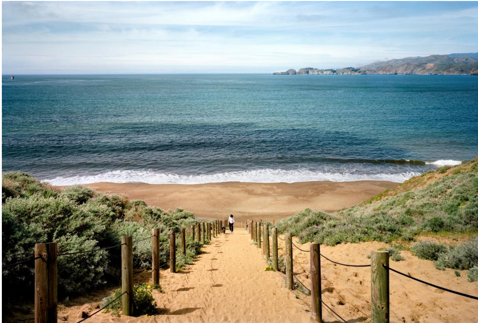
Φωτογραφία 17. Γιώργης Γερόλυμπος, San Francisco California (2008)