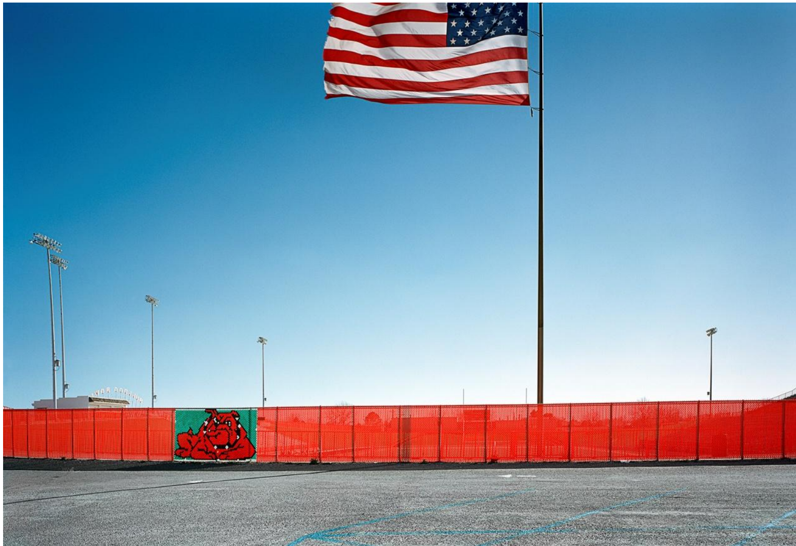
Φωτογραφία 13. Γιώργης Γερόλυμπος, New Mexico (2008)