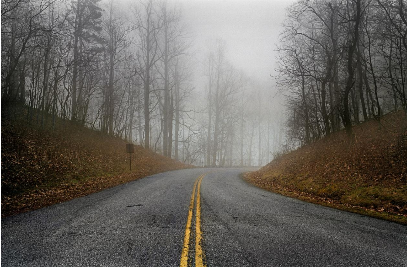
Φωτογραφία 2. Γιώργης Γερόλυμπος, Blue Ridge North Carolina (2008)