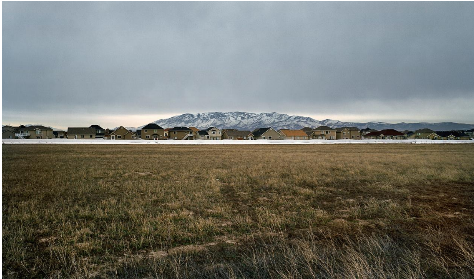
Φωτογραφία 16. Γιώργης Γερόλυμπος, Prono Utah (2008)