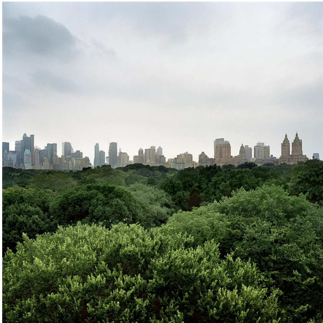
Φωτογραφία 4. Γιώργης Γερόλυμπος, Central Park New York (2008)