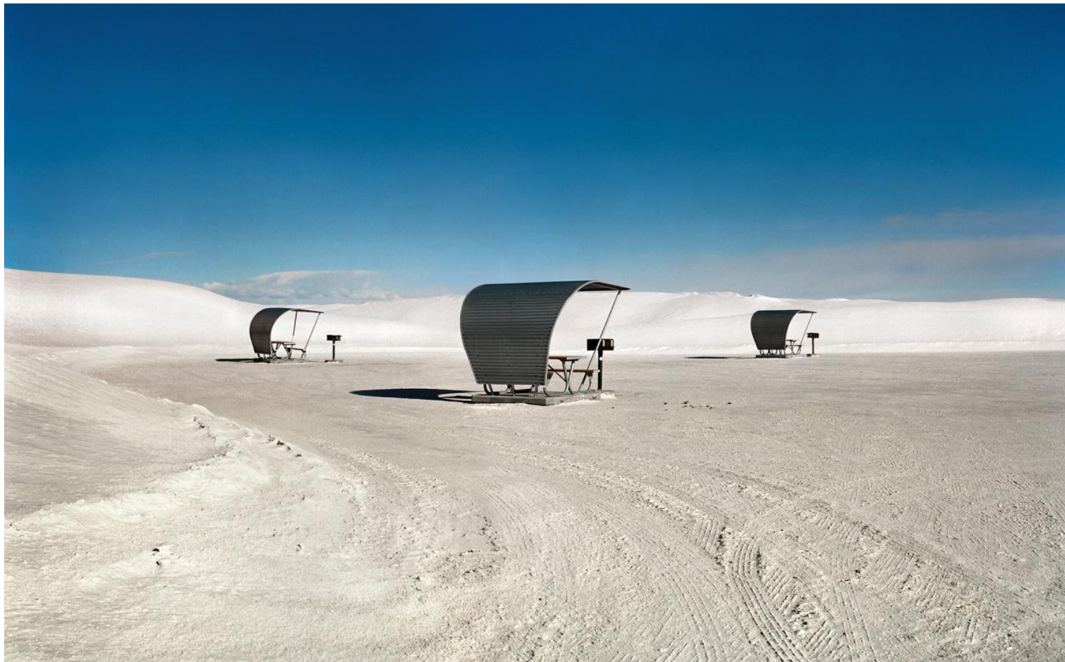
Φωτογραφία 18. Γιώργης Γερόλυμπος, White Sands New Mexico (2008)