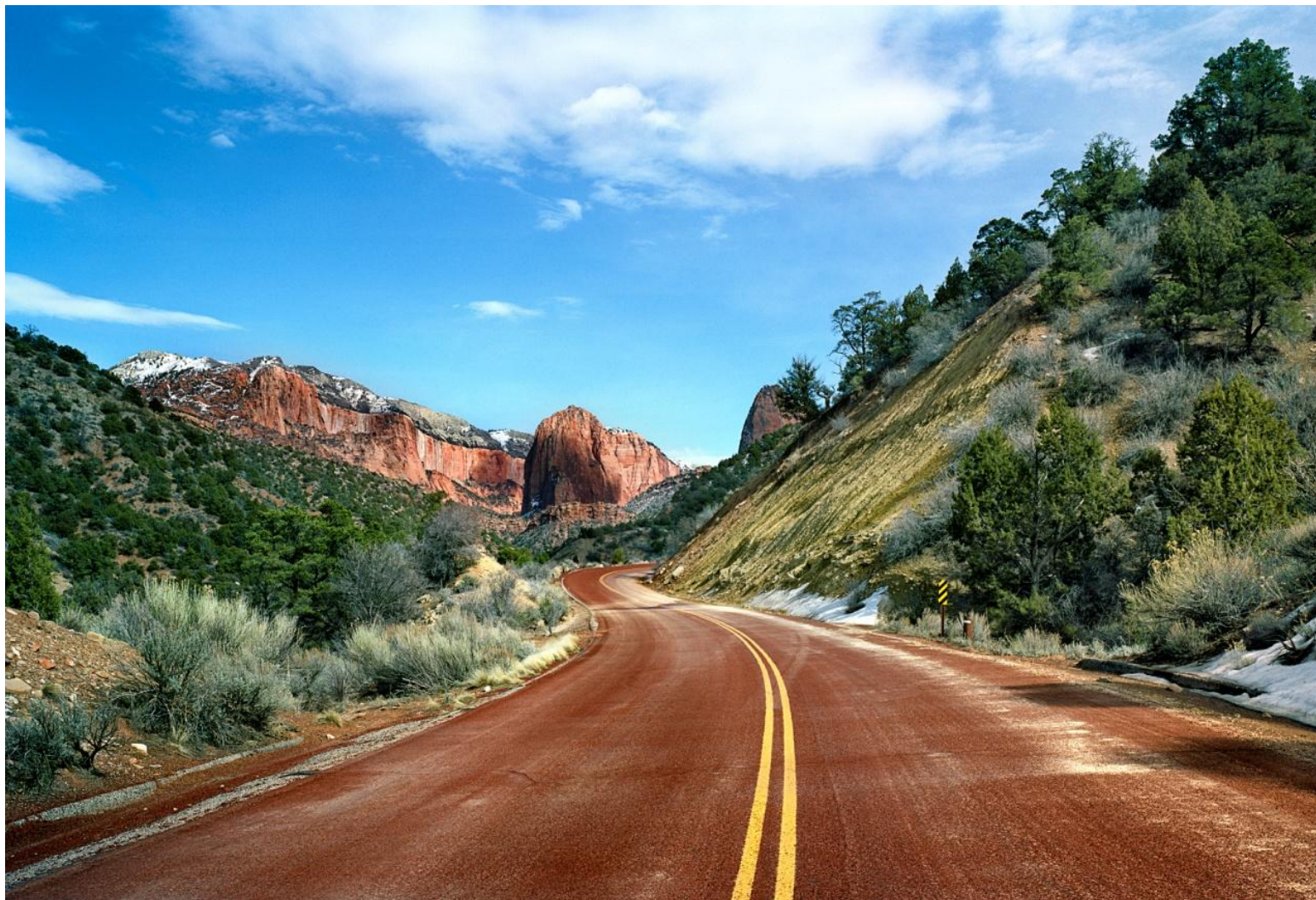
Φωτογραφία 19. Γιώργης Γερόλυμπος, Zion Park Utah (2008)