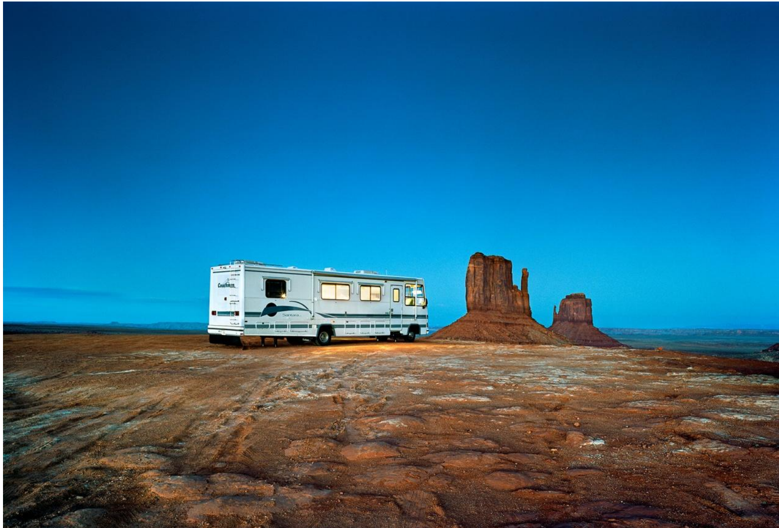
Φωτογραφία 12. Γιώργης Γερόλυμπος, Monument Valley (2008)