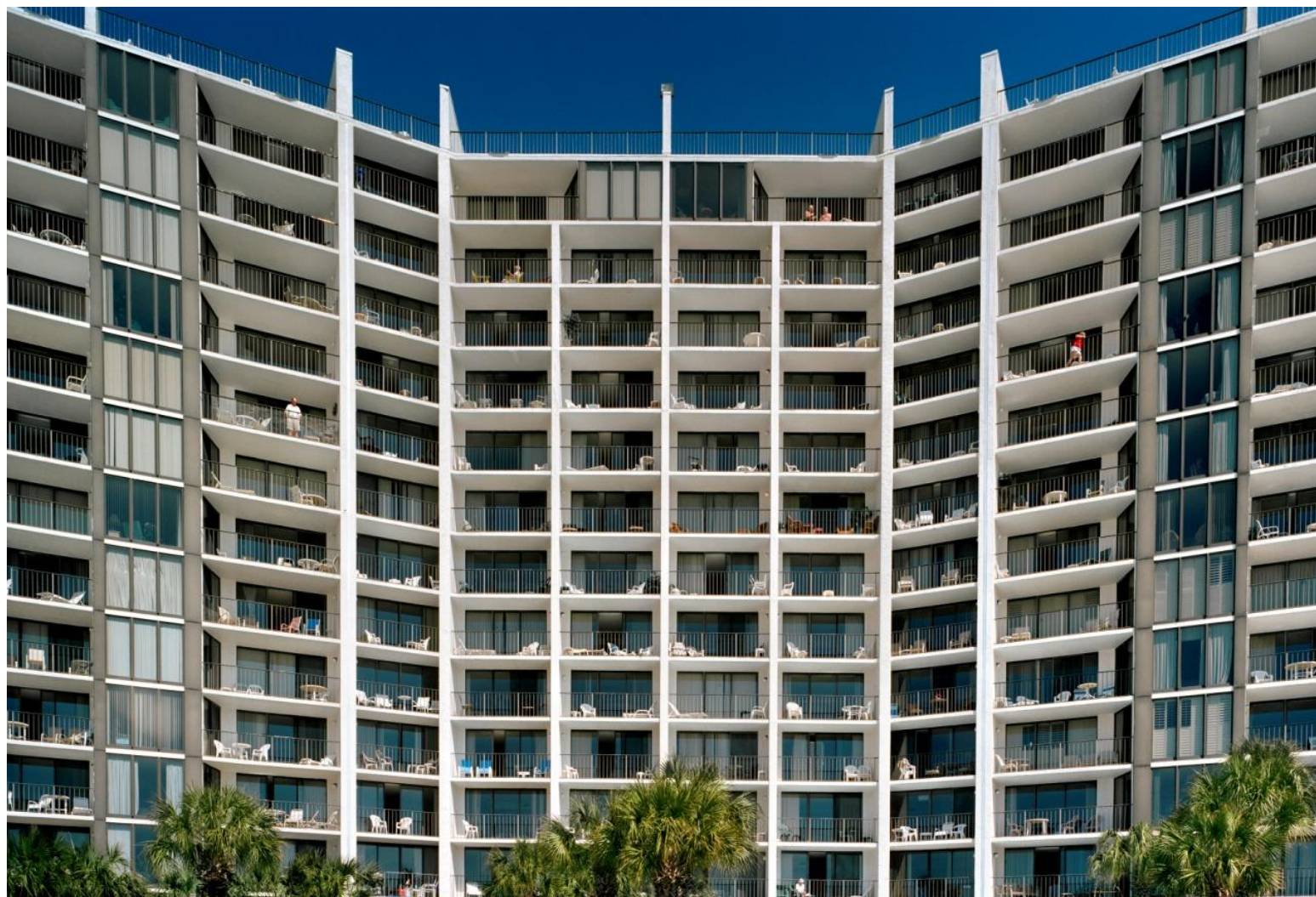
Φωτογραφία 15. Γιώργης Γερόλυμπος, Pensacola Florida (2008)