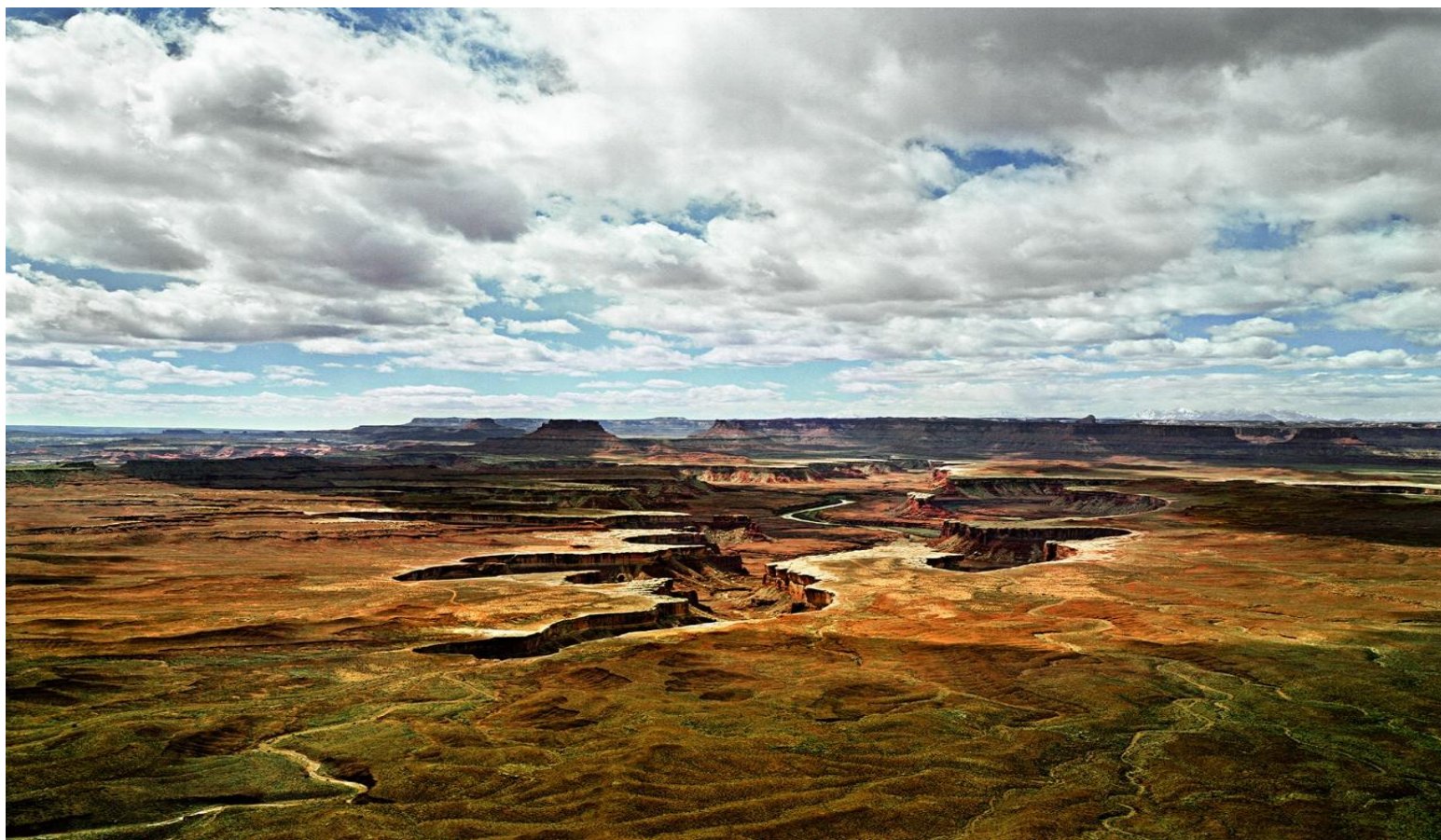
Φωτογραφία 3. Γιώργης Γερόλυμπος, Canyon Lands Utah (2008)