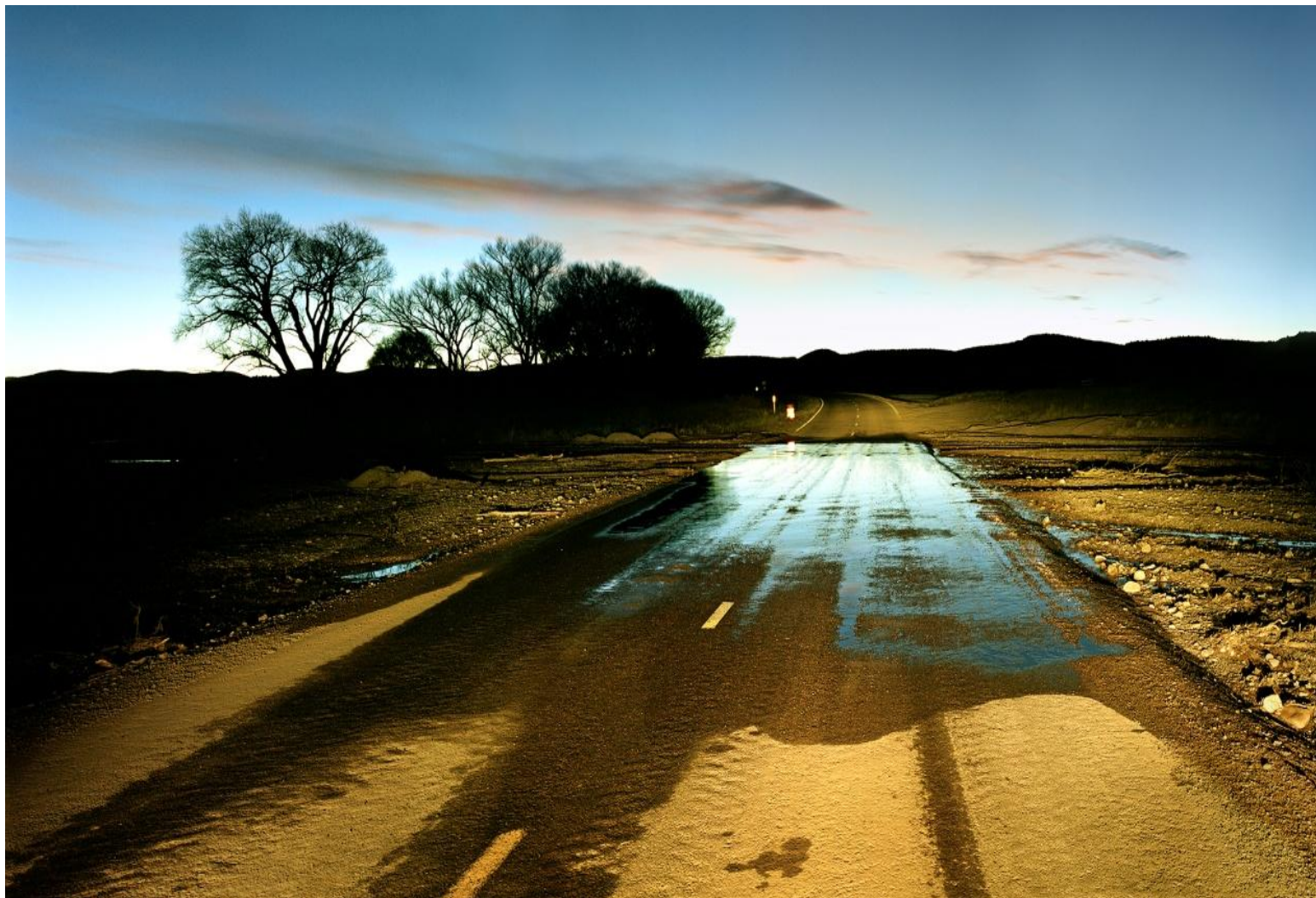
Φωτογραφία 1. Γιώργης Γερόλυμπος, Apachee Reserve Arizona (2008)