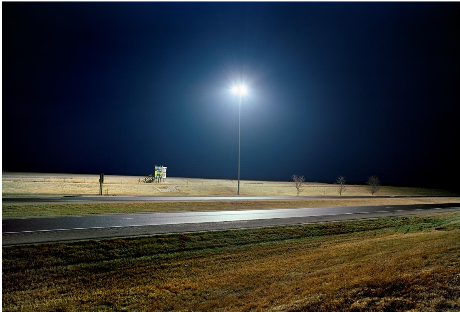
Φωτογραφία 8. Γιώργης Γερόλυμπος, Highway Kansas (2008)