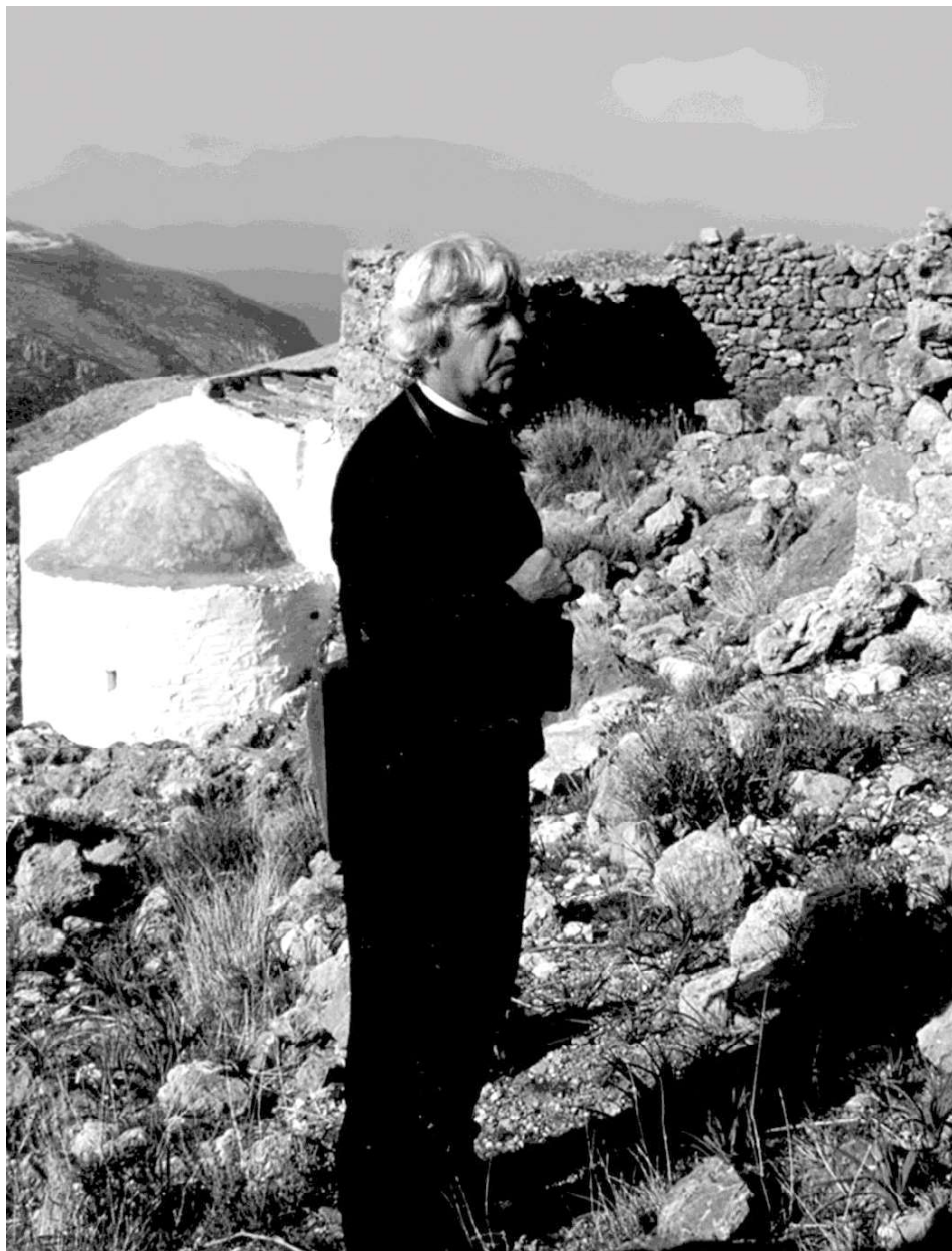
ΣΤΗ ΜΝΗΜΗ ΤΟΥ ΗΛΙΑ ΚΟΛΛΙΑ