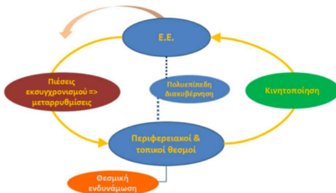
Σχήμα 2: Η επίδραση της ΕΕ στις υποεθνικές αρχές