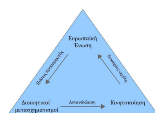
Σχήμα 1: Η διττή φύση της ΕΕ ως παράγοντας πιέσεων και πεδίο ευκαιριών

Υπό μια γενική θεώρηση, αναζητείται το αποτέλεσμα των διοικητικών μετασχηματισμών στο τοπικό και περιφερειακό επίπεδο διακυβέρνησης με όρους υποεθνικής κινητοποίησης (subnational mobilization) ως αντίκτυπος των ενωσιακών επιδράσεων. Οι διοικητικές προσαρμογές προσεγγίζονται υπό την οπτική μιας εξευρωπαϊστικής διαδικασίας , το δε αποτέλεσμα των εξευρωπαϊστικών πιέσεων αποτιμάται με βάση την αντανάκλαση που είχαν οι διαδοχικοί διοικητικοί μετασχηματισμοί στην κινητοποίηση των αυτοδιοικητικών και αποσυγκεντρωμένων αρχών στην ευρωπαϊκή «αρένα» πολιτικής. Ουσιαστικά, η μελέτη διερευνά την εξωστρεφή όψη που έλαβε η διαδικασία του εξευρωπαϊσμού των υποεθνικών θεσμών της χώρας σε συνέχεια πιέσεων προσαρμογής για συμμόρφωση σε ευρωπαϊκές προδιαγραφές και κανόνες λειτουργίας, αλλά και πλαισίωσης εγχώριων πεποιθήσεων και προσδοκιών. Υπ' αυτή την έννοια, η ΕΕ συνιστά μεταβλητή με διττή υπόσταση και ρόλο 6 : αφ' ενός, αποτελεί παράγοντα πιέσεων προσαρμογής και, αφ' ετέρου, πεδίο παροχής ευκαιριών και προσφοράς κινήτρων υποεθνικής κινητοποίησης. Στο Σχήμα 1 επιχειρείται η απεικόνιση της διττής επιρροής της ΕΕ στους εγχώριους αυτοδιοικητικούς και αποσυγκεντρωμένους διοικητικούς θεσμούς.