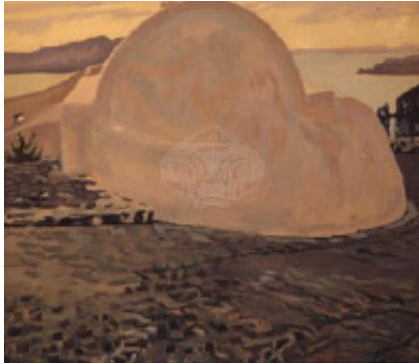
Εικόνα 6: Κωνσταντίνος Μαλέας, «Εκκλησιάκι στη Σαντορίνη» (1924-35).

Το έργο του Κωνσταντίνου Μαλέα «Εκκλησιάκι στη Σαντορίνη», μπορεί να συνδεθεί με τη Θεματική Ενότητα 3 «Φύση» στο παρόν ebook.