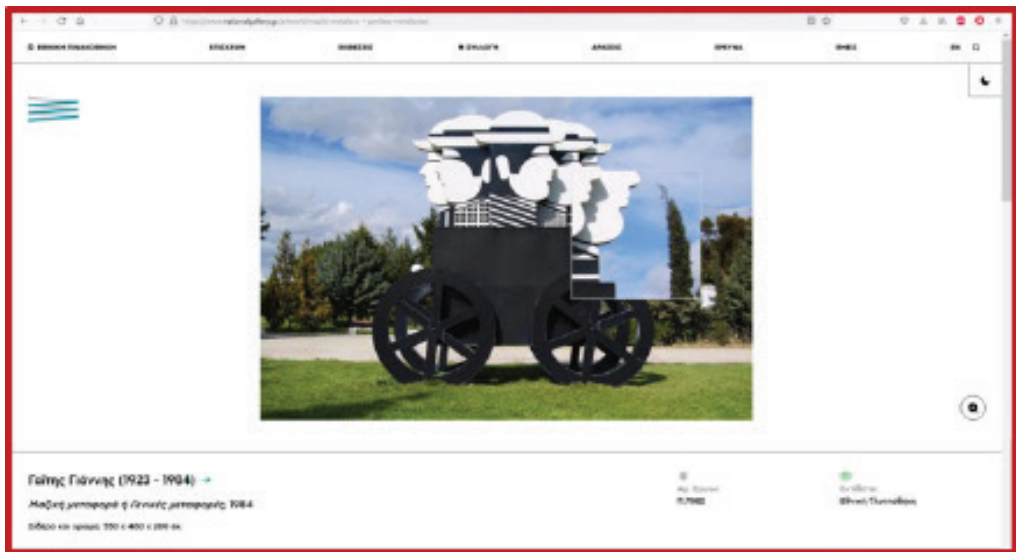
Screenshot από την ιστοσελίδα της Εθνικής Πινακοθήκης - Μουσείο Αλεξάνδρου Σούτσου με το έργο «Μαζική μεταφορά ή Γενικές μεταφορές» του Γιάννη Γαΐτη (1984) με δυνατότητα εστίασης σε λεπτομέρειες του έργου)

Εξερευνώντας τα έργα τέχνης σε ψηφιακή μορφή μπορεί κανείς να βρει πληροφορίες για τους καλλιτέχνες, για τα έργα και την εποχή τους. Μπορεί ακόμα να μεγεθύνει τις εικόνες τους, να τις αποθηκεύσει ή να εστιάσει σε λεπτομέρειες των έργων με βάση τις δυνατότητες που δίνει η ιστοσελίδα.