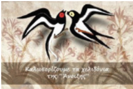
Εκπαιδευτική διαδικτυακή δράση του Εθνικού Αρχαιολογικού Μουσείου «Καλωσορίζουμε τα χελιδόνια της «Ανοιξης» με αφετηρία την Τοιχογραφία της Ανοιξης στο Μουσείο