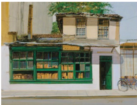
Χριστόδουλος Γκαλντέμης, «Παλιό αρτοποιείο στα Γιάννενα» (1983), Πηγή: Πινακοθήκη Ε. Αβέρωφ – Ίδρυμα Ευάγγελου Αβέρωφ-Τοσίτσα

Το έργο του Χριστόδουλου Γκαλντέμη «Παλιό αρτοποιείο στα Γιάννενα» μπορεί να συνδεθεί με τη Θεματική Ενότητα 4 «Εργασία και βιομηχανία» στο παρόν ebook.