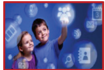
Παιδιά και διαδίκτυο

Το παρόν κεφάλαιο επιχειρεί να αναδείξει τις απεριόριστες δυνατότητες που έχει ο καθένας μας σε ψηφιοποιημένα έργα τέχνης από Μουσεία και Πινακοθήκες της Ευρώπης και του κόσμου, αλλά και του υλικού που τα συνοδεύει. Η εν λόγω διαπραγμάτευση στην ενότητα αυτή του ebook ασφαλώς και δεν είναι διεξοδική αλλά περιλαμβάνει απολύτως ενδεικτικά παραδείγματα δράσεων και δυνατοτήτων διασύνδεσης του μουσείου και του σχολείου μέσω του διαδικτύου και ψηφιακών δράσεων και δεν επεκτείνεται σε άλλες ψηφιακές εφαρμογές που αξιοποιούνται εντός των μουσείων (π.χ. εφαρμογές για κινητές συσκευές ή χωρο-ευαίσθητες εφαρμογές) οι οποίες εξελίσσονται διαρκώς (Γιαννούτσου, 2015).