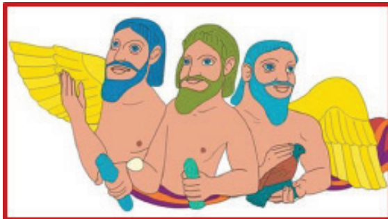
«Τρία σώματα, πόσα χρώματα;». Δραστηριότητα από την παιδική ιστοσελίδα του Μουσείου Ακρόπολης