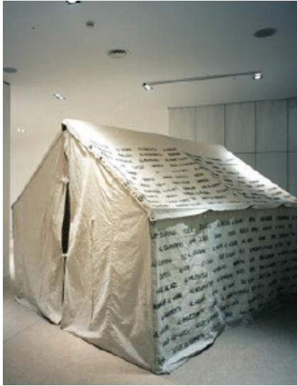
Έμιλυ Ζασίρ, «Εις μνήμην των 418 Παλαιστινιακών χωριών τα οποία καταστράφηκαν, ερημώθηκαν και κατακτήθηκαν από το Ισραήλ το 1948» (2001). http://collection.emst.gr

Το έργο της Έμιλυ Ζασίρ «Εις μνήμην των 418 Παλαιστινιακών χωριών τα οποία καταστράφηκαν, ερημώθηκαν και κατακτήθηκαν από το Ισραήλ το 1948», μπορεί να συνδεθεί με τη Θεματική Ενότητα 8 «Μετανάστες και πρόσφυγες» του παρόντος ebook.