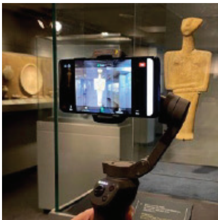
Φωτογραφία από τη δράση « ZOOM » στα σχολεία του Μουσείου Κυκλαδικής Τέχνης (Πηγή: Εδώ . Ημερομηνία τελευταίας πρόσβασης: 8 Φεβρουαρίου 2024)