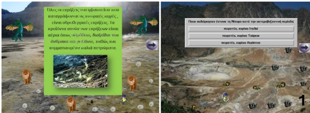
Εικόνα 2. Τα ψηφιακά παιχνίδια

Τέλος, αναπτύχθηκαν τρία ψηφιακά παιχνίδια, χρησιμοποιώντας το Clickteam Fusion 2.5 ( https://www.clickteam.com/ ), το οποίο είναι ένα σχετικά εύκολο λογισμικό για ανάπτυξη εφαρμογών πολυμέσων. Τα ψηφιακά παιχνίδια ήταν παρόμοια με τα επιτραπέζια και ακολουθούσαν την ίδια λογική και κανόνες. Μια εικόνα του ηφαιστείου χρησιμοποιήθηκε ως φόντο και αντί να διαιρεθεί το ταμπλό σε δύο μισά, τα παιχνίδια είχαν δύο επίπεδα, ένα για τα τετράγωνα αμυγδάλου και τις (ψηφιακές) κάρτες αμυγδάλου (χρησιμοποιώντας το εκπαιδευτικό υλικό από τον Πίνακα 1, στήλη Εργαλείο3) και ένα για τα τετράγωνα σουμάδας και τις (ψηφιακές) κάρτες σουμάδας (Εικόνα 2). Οι παίκτες εκπροσωπήθηκαν ως πολεμιστές που εξερευνούσαν το ηφαίστειο ενώ προσπαθούσαν να αποφύγουν τέρατα (τα τετράγωνα «παγίδες» των επιτραπέζιων παιχνιδιών).