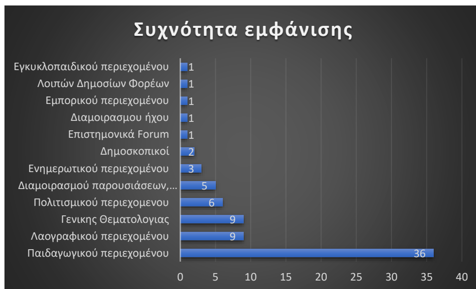
Γράφημα 1. Συχνότητα εμφάνισης ιστοσελίδων

Στη συνέχεια θα επιχειρήσουμε να παρουσιάσουμε συνοπτικά τα αποτελέσματα της έρευνάς μας σχετικά με το πλαίσιο αναφοράς των λέξεων κλειδιά λάχνισμα/λαχνίσματα σε ιστοσελίδες του Διαδικτύου. Σύμφωνα με αυτά από τις 75 ιστοσελίδες: α) 36 ιστοσελίδες (ποσοστό 48%) είναι παιδαγωγικού περιεχομένου, β) 9 ιστοσελίδες (12%) είναι λαογραφικού περιεχομένου, γ) 9 ιστοσελίδες είναι γενικότερης θεματολογίας, δ) 6 ιστοσελίδες (8%) είναι γενικότερου πολιτισμικού υλικού, ε) 5 ιστοσελίδες ανήκουν στην κατηγορία διαμοιρασμού κειμένων, παρουσιάσεων και γραφημάτων στ) 3 ιστοσελίδες είναι ενημερωτικής φύσης και ακολουθούν ιστοσελίδες εγκυκλοπαιδικές, εμπορικές, επιστημονικών forum, κ.α. (Γράφημα 1).