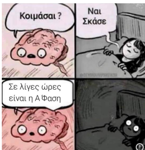
Εικόνα 3. Διαδικτυακό μμίδιο θεματικής κατηγορίας «Σύστημα προσλήψεων» Σημείωση. Θανάσης Μπουλογεώργος. (2020, Αύγουστος 24). Δεν έχω κάτι με τους δικηγόρους. Έχω και φίλους δικηγόρους. Αρκεί να μην προκαλούν παίρνοντας αποφάσεις για εκπαιδευτικά ζητήματα ως [Επισυναπτόμενο διαδικτυακό μμίδιο] [Ανάρτηση στην ομάδα «Μισθολογικά και Εργασιακά