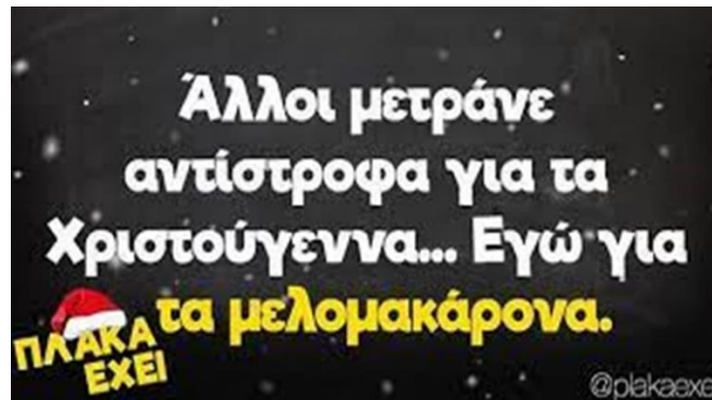
Εικόνα 2. Διαδικτυακό μίμιο σχετικό με το Δωδεκαήμερο ( https://gr.pinterest.com/pin/835347430868479370/ ) (τελευταία ανάκτηση 26/10/2021)

αφορούν το Δωδεκαήμερο και αφορούν κυρίως την ποσότητα των μελομακάρων που καταναλώνονται στις γιορτές αλλά και την αντίστροφη μέτρηση για το πότε θα έρθουν οι μέρες της κατανάλωσής τους (Εικόνα 2).