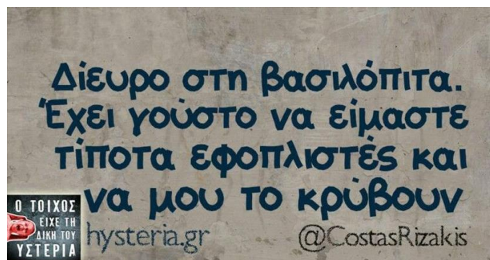
Εικόνα 3. Διαδικτυακό μίμιο σχετικό με το Δωδεκαήμερο ( https://gr.pinterest.com/pin/475270566906605872/ ) (τελευταία ανάκτηση 26/10/2021)

Αρκετά ήταν και τα μίμια που αφορούσαν τα κάλαντα (7 από τα 59), καθώς είναι ένα έθιμο, το οποίο αναβιώνει στην εποχή μας πολύ έντονα. Βέβαια σε κάποια από τα μίμια διαφαίνεται μια ενόχληση σχετική με αυτό το έθιμο καθώς σε πολλά στίγια τα παιδιά που λένε τα κάλαντα δεν είναι ευπρόσδεκτα ή υπάρχει κάποια κριτική ως προς την εκτέλεση των τραγουδιών ή την αμφίεσή τους. Ακολουθούν τα μίμια που σχετίζονται με το έθιμο της Βασιλόπιτας (5 από τα 59), τα οποία αναφέρονται κυρίως στο φλουρί και στην κατανάλωση του εδέσματος (Εικόνα 3) και τα μίμια που σχετίζονται με το δώρο που θα φέρει ο Άγιος Βασίλης (4 από τα 59), αναφερόμενα κυρίως στην τιμή του δώρου και ακολουθώντας έτσι τα καταναλωτικά πρότυπα.