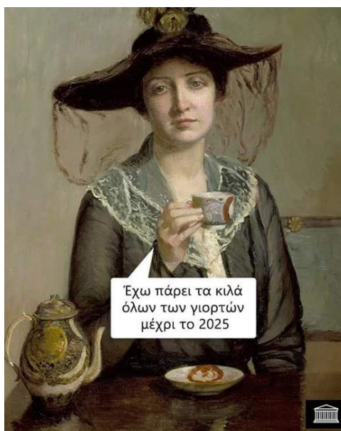
Εικόνα 1. Διαδικτυακό μιμίδιο σχετικό με το Δωδεκαήμερο

Από τα μιμίδια που αφορούν τα Χριστούγεννα, πολλά από αυτά (13 από τα 59) σχετίζονται με το φαγητό και το γιορτινό τραπέζι. Όπως φαίνεται και στην Εικόνα 1 τα μιμίδια που αφορούν το γιορτινό τραπέζι και το φαγητό συνοδεύονται από εικόνες, οι οποίες παρουσιάζουν ανθρώπους να τρώνε ή να πίνουν, ενισχύοντας έτσι το χιουμοριστικό χαρακτήρα του εκάστοτε μιμιδίου και το νόημα που εκφράζεται μέσα από αυτό.