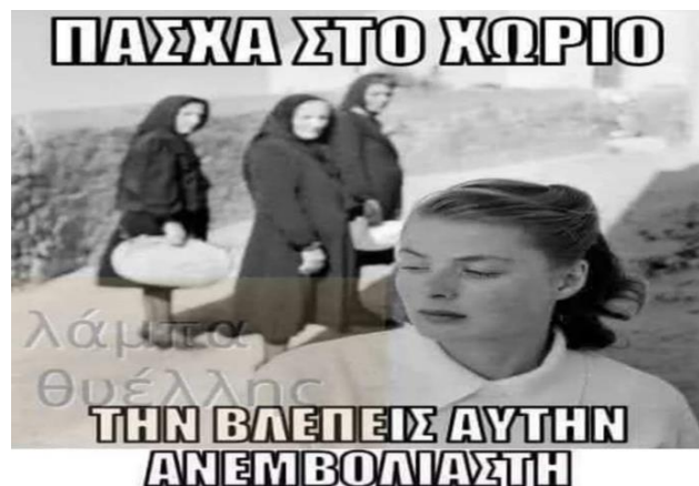
Εικόνα 7. Διαδικτυακό μιμίδιο σχετικό με τη γιορτή του Πάσχα ( https://www.Facebook.com/1883732248566605/photos/a.1883735775232919/2920400898233063/?type=3 (τελευταία ανάκτηση 26/10/2021))