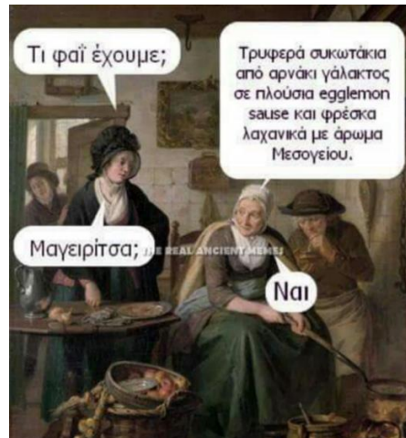
Εικόνα 6. Διαδικτυακό μιμίδιο σχετικό με τη γιορτή του Πάσχα ( https://sapsalis.gr/asteio/5719762801786880 (τελευταία ανάκτηση 26/10/2021))

Σχετικά με τα μιμίδια που αναφέρονται στο εορτασμό του Πάσχα η συντριπτική πλειοψηφία τους (16 από τα 26) σχετίζεται με το τραπέζι του Μεγάλου Σαββάτου και της Κυριακής του Πάσχα αλλά και με το έθιμο του σουβλίσματος του αρνιού. Για παράδειγμα στην Εικόνα 6 παρουσιάζεται ένα μιμίδιο το οποίο περιλαμβάνει σκίτσο και κείμενο. Στο σκίτσο απεικονίζονται γυναίκες ντυμένες με ρούχα εποχής και το κείμενο αποτελείται από τον διάλογό τους σχετικά με το φαγητό την ημέρα της Ανάστασης, ο οποίος είναι ιδιαίτερα σαρκαστικός. Επιπλέον, στα μιμίδια αυτής της γιορτής λόγω του φαγητού και των τραπεζιών εκφράζονται και νέες διατροφικές συνήθειες που ακολουθούν αρκετοί άνθρωποι στις μέρες μας (vegetarian, vegan κ.λπ.).