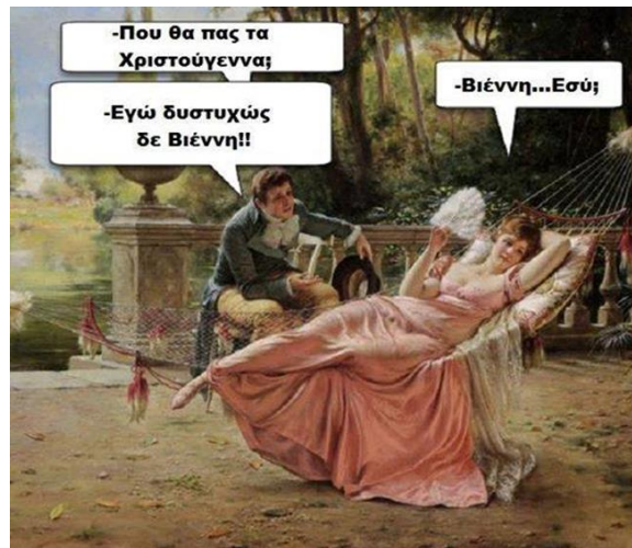
Εικόνα 4. Διαδικτυακό μίμδιο σχετικό με το Δωδεκαήμερο ( https://m.facebook.com/pg/realancient/photos/?tab=album&album_id=2459904317557754 (τελευταία ανάκτηση 26/10/2021)

τις επερχόμενες διακοπές τους. Μάλιστα στο συγκεκριμένο μίμδιο γίνεται και χρήση του λογοπαίγνιου «Βιέννη-δε βγαίνει» για να ενισχυθεί η χιουμοριστική διάθεσή του.