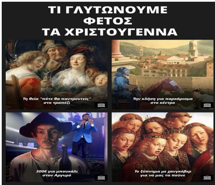
Εικόνα 9. Διαδικτυακό μμίδιο σχετικό με την αρνητική διάθεση προς τις γιορτές ( https://m.Facebook.com/realancient/photos/a.1921703051377886/2779079818973534/?type=3 ) (τελευταία ανάκτηση 26/10/2021)