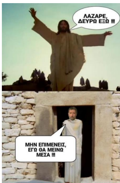
Εικόνα 8. Διαδικτυακό μιμίδιο σχετικό με την πανδημία ( https://www.monopoli.gr/2020/04/19/istories/perierga/384654/keep-calm8-proetoimasies-gia-ena-diaforetiko-rasxa/ (τελευταία ανάκτηση 26/10/2021))

Καθώς η έρευνα πραγματοποιήθηκε κυρίως σε μιμίδια που αναρτήθηκαν από τον Ιανουάριο του 2020 έως το Μάιο του 2021, δε θα μπορούσαν να λείπουν τα μιμίδια τα οποία σχετίζονται με τον τρόπο εορτασμού των γιορτών στην περίοδο της πανδημίας του COVID-19, καθώς ήταν μια κατάσταση που επηρέασε άμεσα τις συνήθειες των γιορτών και φυσικά αυτό αντικατοπτρίζεται μέσα από τα μιμίδια. Στην Εικόνα 8, για παράδειγμα, παρουσιάζεται ένα μιμίδιο στο οποίο απεικονίζεται ο Ιησούς από τη γνωστή ταινία «Ο Ιησούς από τη Ναζαρέτ» να προτρέπει τον Λάζαρο να βγει έξω, αλλά αντί για τον Λάζαρο του απαντάει γνωστός παρουσιαστής ο οποίος συμμετείχε στην διαφήμιση για την παραμονή στο σπίτι λόγω της πανδημίας. Για την κατανόηση του συγκεκριμένου μιμιδίου απαιτείται η γνώση τόσο της ταινίας και της διαφήμισης όσο και των διαλόγων σε αυτές.