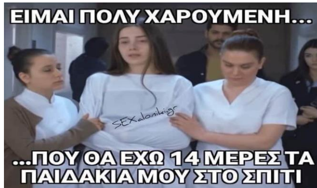
Εικόνα 1. Αναπληρωτές μέσω ΕΣΠΑ, https://www.facebook.com/groups/144161868965419/permalink/2715896771791903/

Το μιμίδιο αυτό ανήκει στην κατηγορία οι μάσκες που μοιράστηκαν στα σχολεία από την Κυβέρνηση, οι υπεύθυνοι για αυτό και το μεγάλο και μη λειτουργικό μέγεθός τους . Το γραπτό μήνυμα της Εικόνας 2 αποτελεί μια πρόταση που θα έλεγε ένας εκπαιδευτικός μέσα σε μια τάξη. Σχολιάζει το μέγεθος της μάσκας, αναφέροντας ότι καλύπτει ολόκληρα τα πρόσωπα των παιδιών, με αποτέλεσμα οι εκπαιδευτικοί να μην μπορούν πια να διακρίνουν τα πρόσωπα των μαθητών τους. Η χιουμοριστική λύση που φαίνεται να βρήκε ο εκπαιδευτικός στο μιμίδιο, είναι να αριθμήσει τις μάσκες και να μην ξεετάζει τα παιδιά με το όνομά τους, αλλά με τον αριθμό της μάσκας τους.